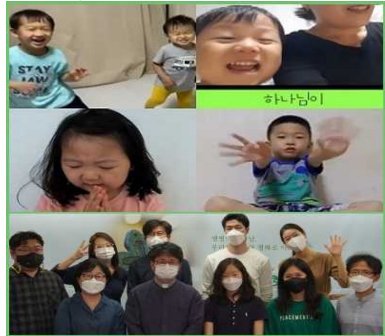
유아/유치부 (유아들이 만드는 예배) 예배위원, 미디어팀, 예배, 성가대